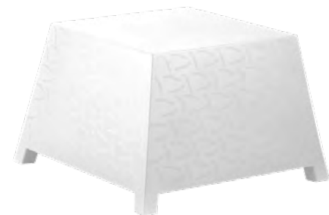
TABLE BASSE RAFFY