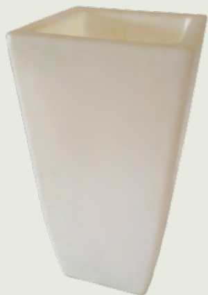
POT BORÉAL Haut. 90 cm.