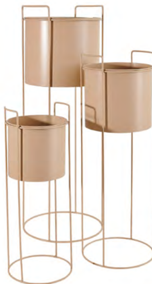
LOT DE 3 CACHE-POTS Métal beige, haut. 50, 60 et 70 cm.