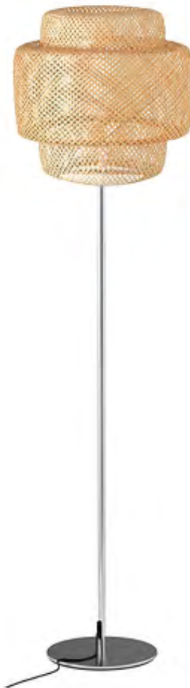
LAMPE LIGHT FLO

Abat-jour au choix : blanc, bambou/osier.