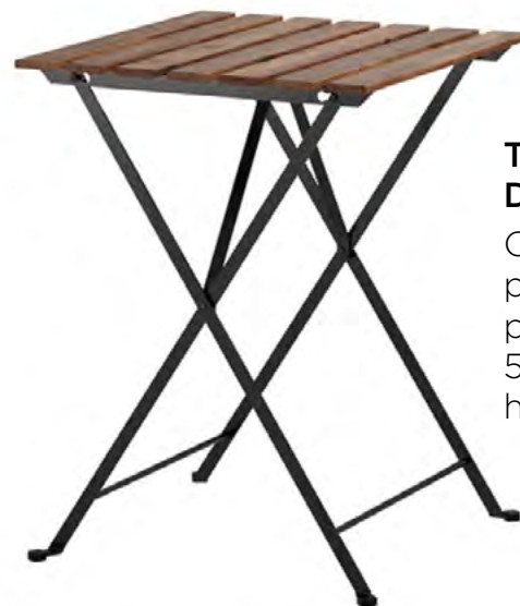
TABLE DE JARDIN

À lattes, métal blanc, rouge, orange, turquoise.