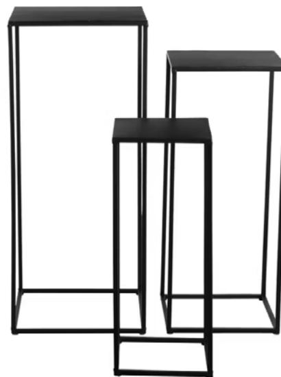
LOT DE 3 STÈLES POUR PLANTES Métal noir, haut. 50, 60 et 70 cm.