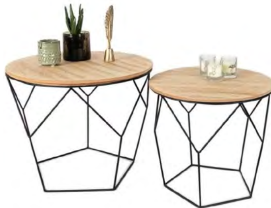
TABLE BASSE ART DÉCO

Plateau bois, pieds métal noir, Ø 25 et 35 cm.