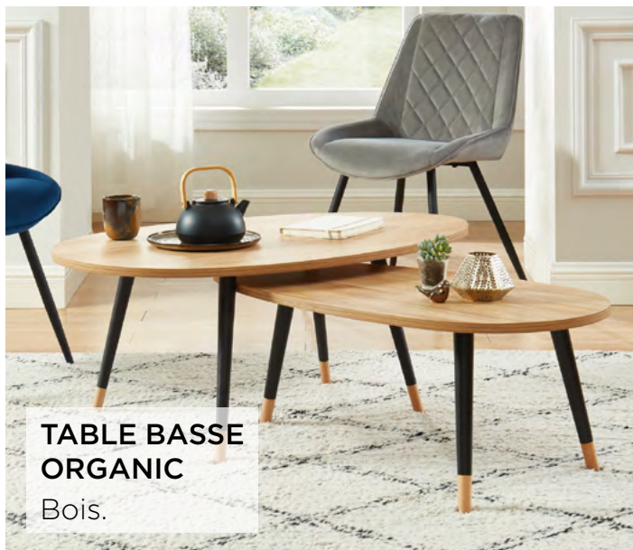
TABLE BASSE ORGANIC

Plateau bois, pieds métal noir, Ø 25 et 35 cm.