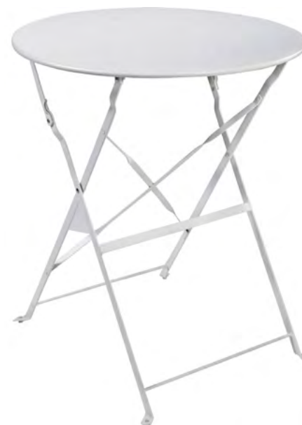
TABLE DE JARDIN

Carrée, plateau bois, pieds métal noir, 50 × 50 cm, haut. 75 cm.