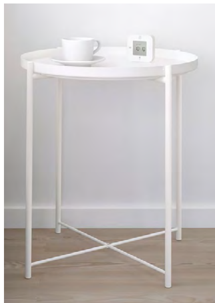
TABLE BASSE GLAD