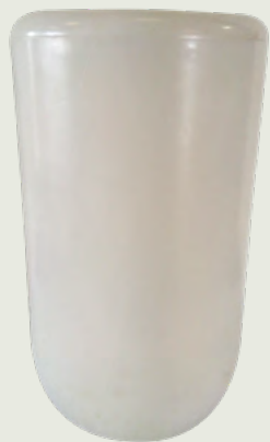
POT BLOOM Haut. 90 cm.